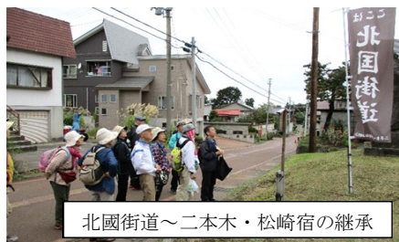
北国街道～二本木・松崎宿の継承