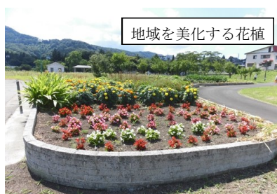
地域を美化する花植