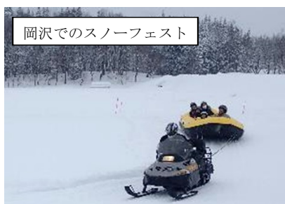
岡沢でのスノーフェスト