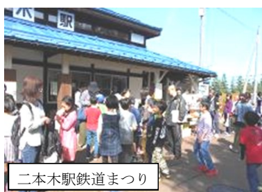
二本木駅鉄道まつり