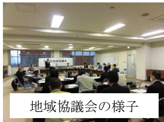
地域協議会の様子

新会長のもと、4名の新任委員を迎え5期目の地域協議会がスタートしました。コロナ禍による全国緊急事態宣言下、まず地域活動支援事業の審査に取り組み、追加募集を含めた12団体の採択を行いました。これと平行しながら自主的審議事項の「未来の子ども達がいつまでも住み続けたいまちづくり」をテーマとした事業案を4つに絞り、班ごとに内容をまとめました。詳しい内容は地域協議会だより53号に載せましたが、そこに至るまでの現地視察や、小・中学生との意見交換会を重ねる中で交わされた協議の数々などは全て委員にとって学びの場でありました。また、1月23日の地域の方々との意見交換会と3月13日の活動報告会では、様々なご意見をいただき、多角的な見方の大切さを改めて教えられました。