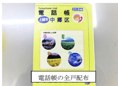
電話帳の全戸配布