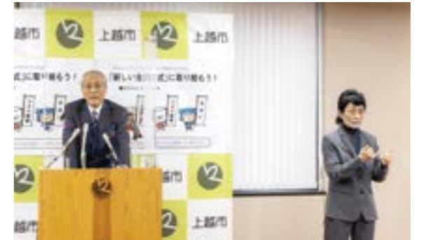
①昨年11月から、市長定例記者会見で手話通訳者を配置 (動画はYouTubeで配信しています)