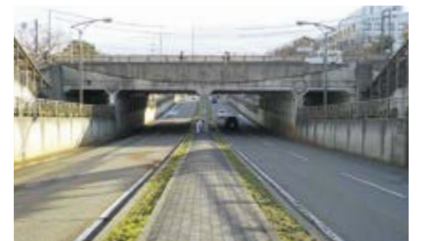
③春日山アンダーパス