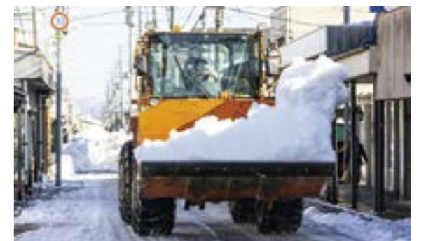
④今年1月に実施した高田地区における一斉屋根雪下ろしの排雪作業

除排雪機械の作業従事に必要な資格の取得を希望する人 (満61歳未満) に対して、資格取得に要する経費の一部を補助します。【関連写真④】