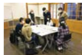
高校生によるプロモーション映像作成のミーティング

若者が気軽に参加しやすい交流会を開催するとともに、高校生による当市の魅力を伝える映像制作コンテストを通じて、ふるさとに対する理解と愛着の醸成を図ります。