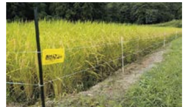
②有害鳥獣対策として水田に設置した電気柵

有害鳥獣の捕獲と電気柵の新設などに向けた取り組みを支援します。また、学習会の開催や外部専門家による「集落環境診断」の導入など、鳥獣が出没しにくい環境づくりを推進します。【関連写真②】