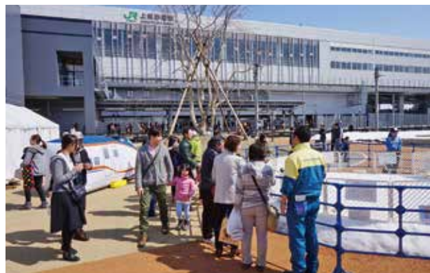
新幹線開業日のイベントで賑わう西口駅前広場