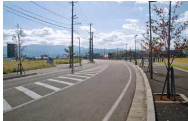
① 都市計画道路 新幹線駅西口線