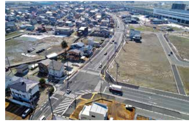
⑤ 都市計画道路 薄袋荒町線