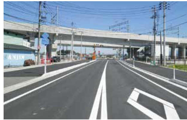
② 都市計画道路 黒田脇野田線