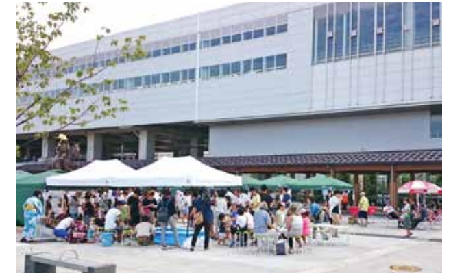
夏祭りで賑わう東口駅前広場