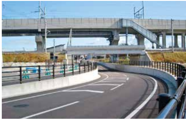
③ 都市計画道路 新幹線駅環状線