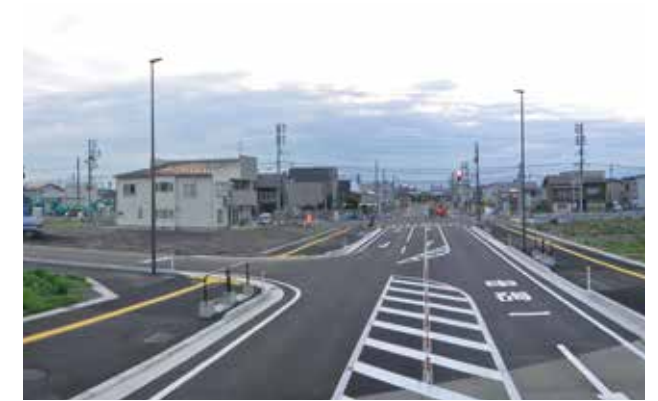
⑥ 都市計画道路 脇野田岡原線