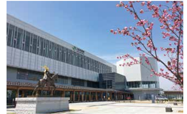
⑦ 東口駅前広場と上杉謙信公像