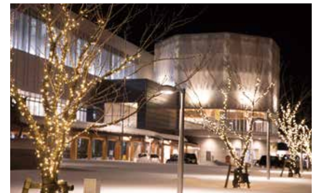
冬季のイルミネーション