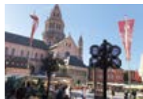
マインツ大聖堂前の市場「週の市」

ちなみに、「ウォッヘンマルクト」で販売される野菜などは量り売りで、値段は100g当たりの金額として表示されることが多いです。