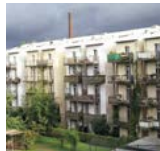
ドイツ北部ハンブルク、住宅のバルコニー