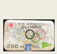
所蔵：板倉区 平田さん

戦争によって開催中止となったさまざまなスポーツイベ ントや戦争とスポーツに関する資料を展示します。 「戦争のため中止となった1940年東京オリンピックの記念品」