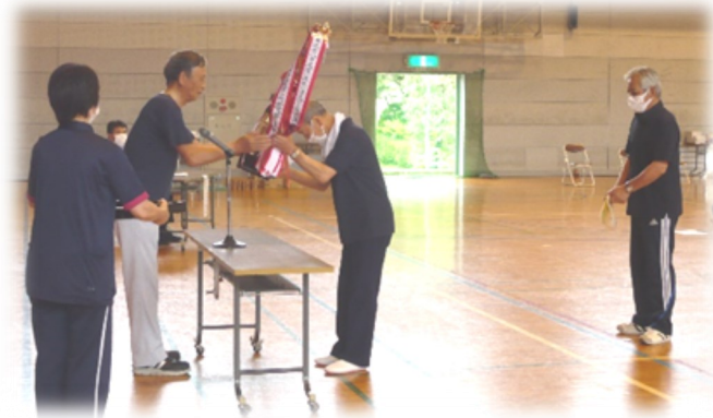
総合優勝の日吉会