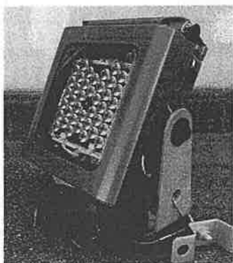
貸出用照明器具19台。