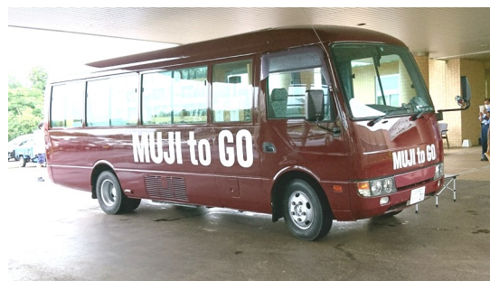
無印良品 移動販売バス

※上越市と(株)良品計画（無印良品）、頸城自動車(株)の三者は、「地域活性化に向けた包括連携に関する協定」を締結しており、中山間地域等への移動販売もその一環で行われています。