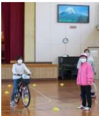
大島小学校の交通安全教室