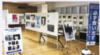
昨年の様子：直江津学びの交流館