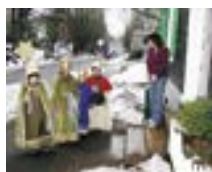
シュテルンズィンゲンで近所の家を訪れる子どもたち

に「KMB」と書いたりするなど、書き方は地域によって少し異なりますが、これを書くことで天の祝福を呼ぶと言われています。