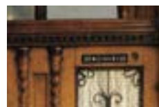
家の玄関の扉にチョークで新年の西暦と「CMB」と書きます。これは2018年のものです

これからの時期にドイツを訪れると、家の玄関の扉にチョークで「20*C+M+B+22」などと書かれている家をよく見掛けるでしょう。