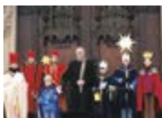
教会の正面玄関の扉にも西暦と「CMB」を書きます

この「CMB」とは、3人の王様の名前の頭文字であると伝えられています。その名前は「カスパール」、「メルヒオール」と「バルタザール」とされており、「CMB」の代わり