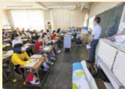
市内小学校での人権出前授業

インターネットの特性を理解した上で、情報を発信する前に「もし自分がこんなことを書かれたら」と見直してみるなど、考えながら利用していきたいですね。