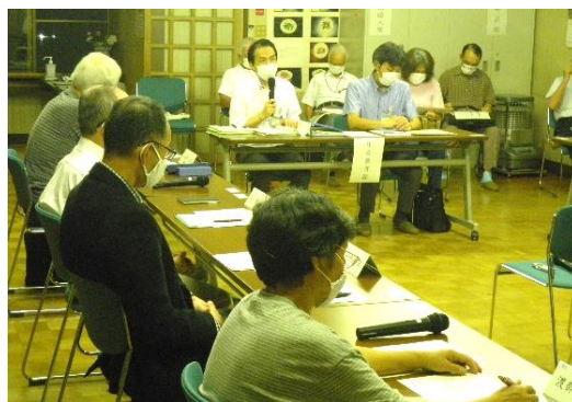
▲9/14 地域協議会での市の説明

また、次期財政計画の期間についての質問に、市は「令和5年度の計画に盛り込んでいく」と回答しました。