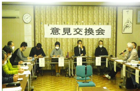
▲意見交換会の様子

地域協議会では、今後もよりよい地域づくりのため、地域の皆さんの声をお聞きし活動していきます。