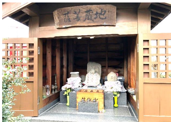
(所在地：大和1丁目10番12号)

災難除け、子授かり、安産、子育て、特に赤ちゃんの夜泣きにご利益があると言われており、子育て地蔵とも呼ばれ、近郷近在の信仰を集め、遠方からも参拝されています。(参考：冊子「七ヶ所新田 むらの歴史」)