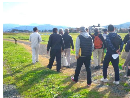
▲釜蓋遺跡公園の視察の様子