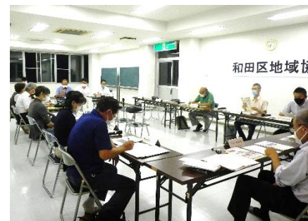
▲第4回地域協議会の様子

第4回地域協議会（9月29日開催）では、市の文化行政課から釜蓋遺跡について説明を受けました。