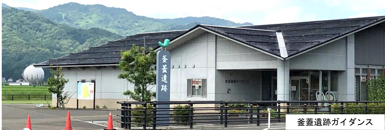
釜蓋遺跡ガイドンス

和田区地域協議会では「上越妙高駅周辺の整備、活性化について」をテーマにして話合っています。前号では、駅周辺の土地利用の現状等に関する市担当課からの説明等を掲載しました。今号では、釜蓋遺跡に関する市担当課からの説明等を掲載します。詳しくは2～3頁をご覧ください。