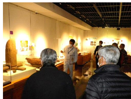
▲釜蓋遺跡ガイダンスの視察の様子