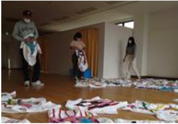
シャツ作品制作ボランティア (安国寺通り特設会場)