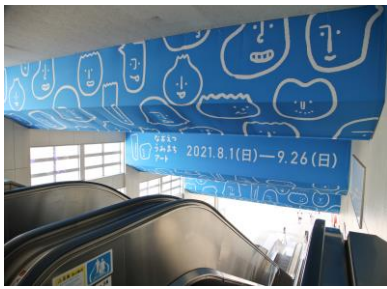
駅内大型看板 (直江津駅構内)