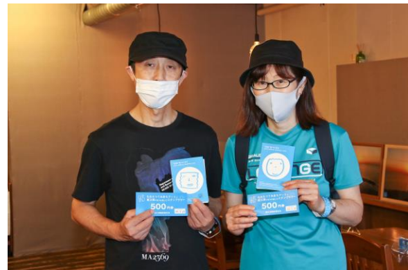
スタンプラリー② (インフォメーションセンター)