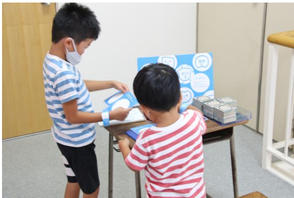
スタンプラリー① (安国寺通り特設会場)