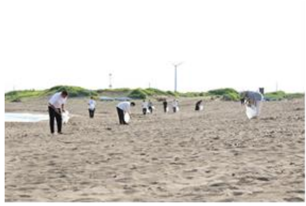
クリーン活動 (船見公園周辺)