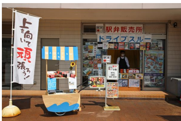
小さな屋台の活用① （ハイマート）