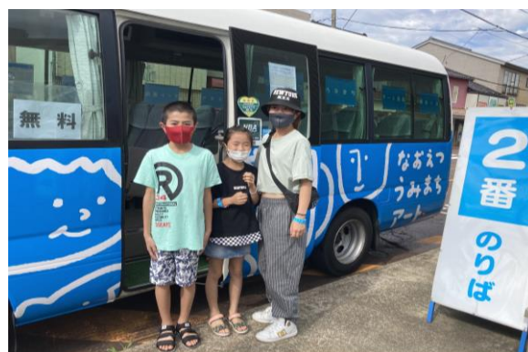
循環バス② (直江津ショッピングセンター前)