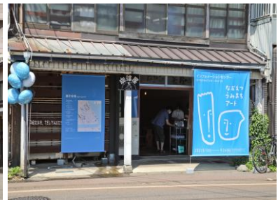
案内所・展示会場案内サイン (インフォメーションセンター)