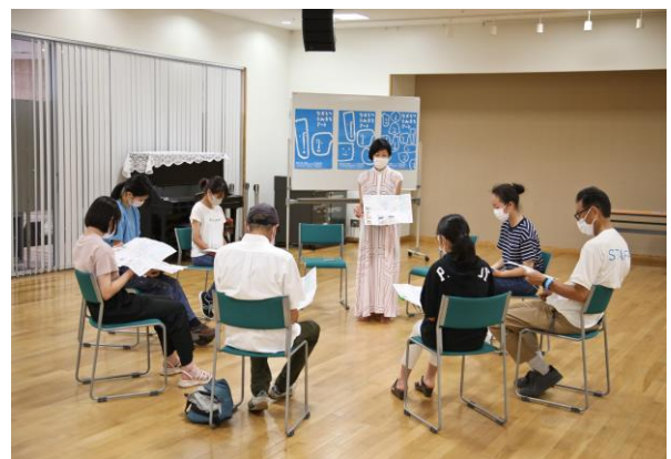
うみまちアート・トーク (直江津学びの交流館)