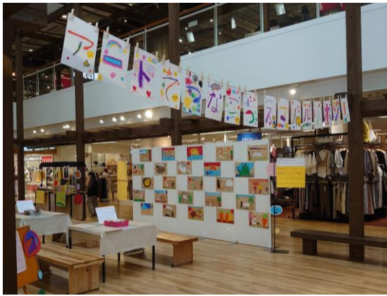
アートでつなごうスマイルリボン！ (直江津 SC エルマール)