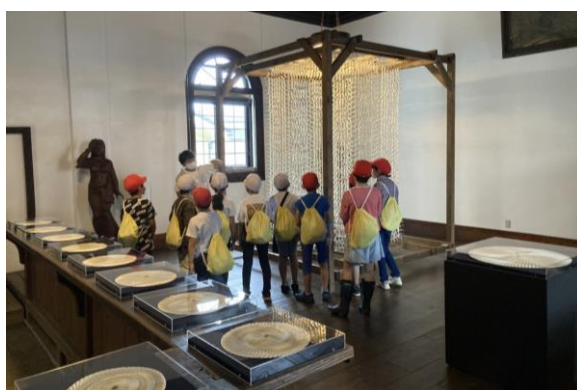
直江津南小学校3年生見学 (ライオン像のある館)