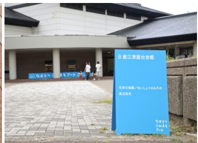
会場サイン (立て看板) (直江津屋台会館)