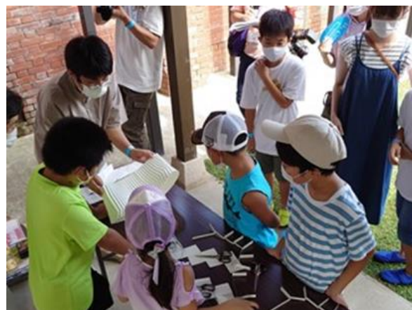
紙の造形ワークショップ （ライオン像のある館）