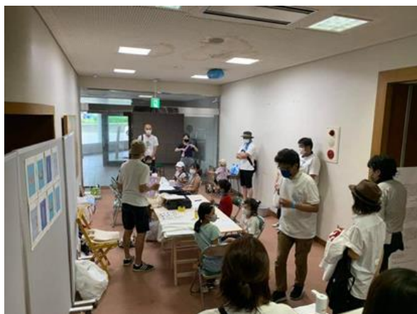
作品を作ろう！ワークショップ （直江津屋台会館）