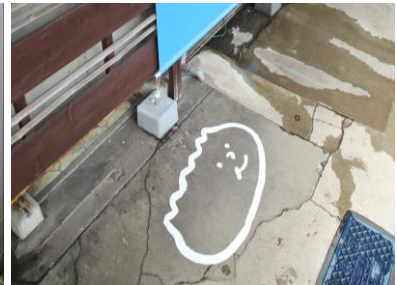
会場誘導サイン③ (インフォメーションセンター)