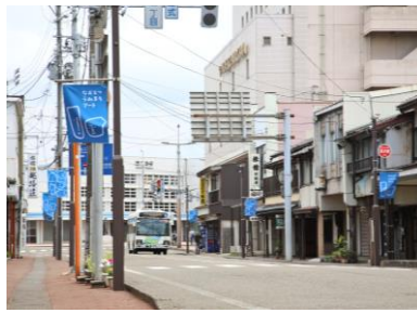
商店街通りフラッグ (駅前商店街通り)