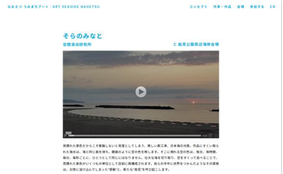
作家・作品ページ