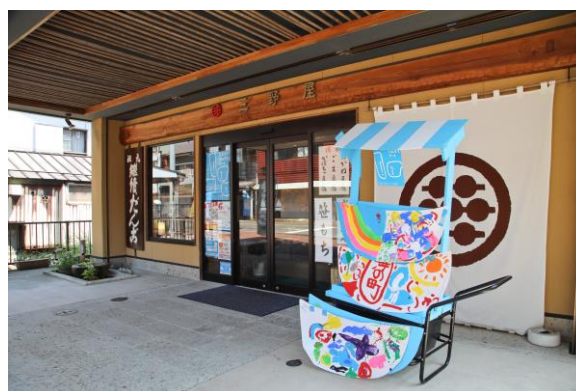
小さな屋台の活用② （三野屋）