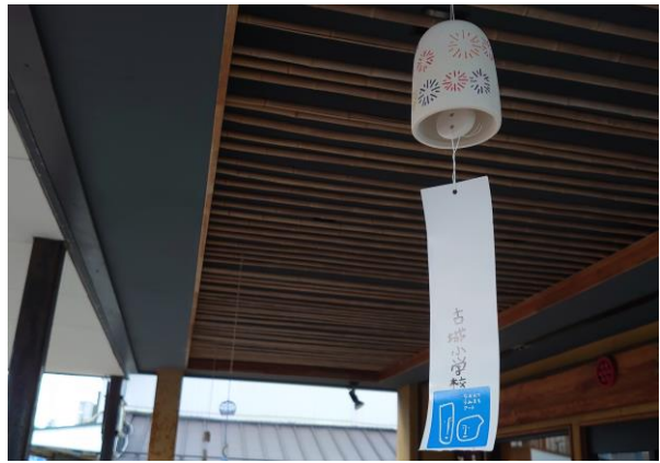
うみまちの風でおもてなし (三野屋)