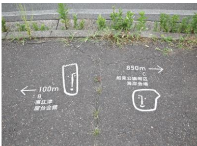
会場誘導サイン④ (直江津屋台会館付近)