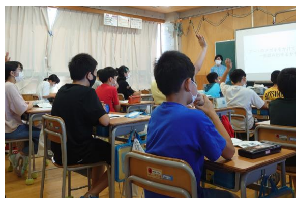
鈴木キュレーターによる特別授業 (直江津小学校)