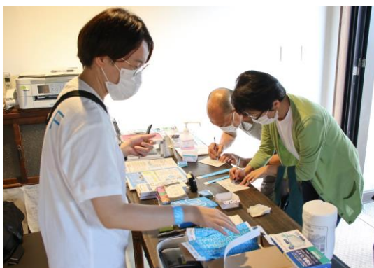
受付簿への記名 (ライオン像のある館)