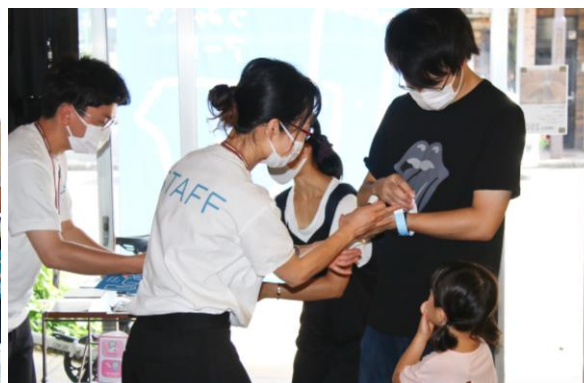
リストバンドの着用 (インフォメーションセンター)