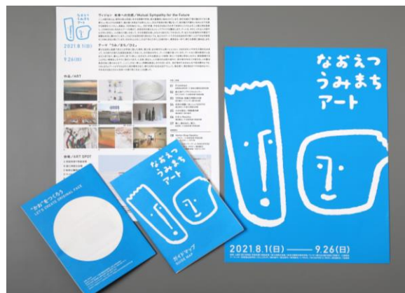
ガイドマップ・チラシ