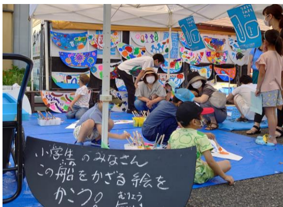
互の市アートマルシェ (互の市広場)