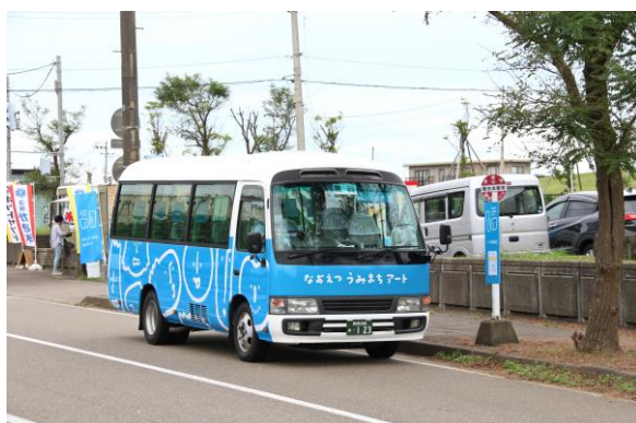
循環バス① (直江津屋台会館前)