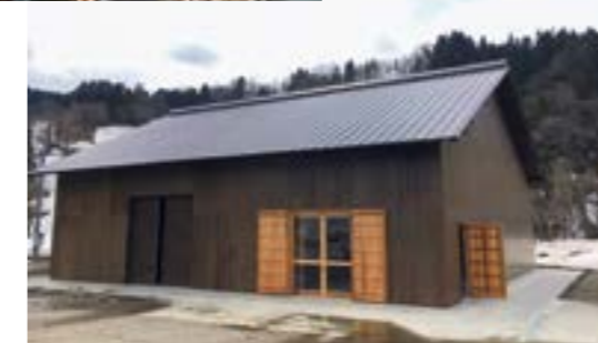
雪冷熱を活用した貯蔵施設 (ユキノハコ)