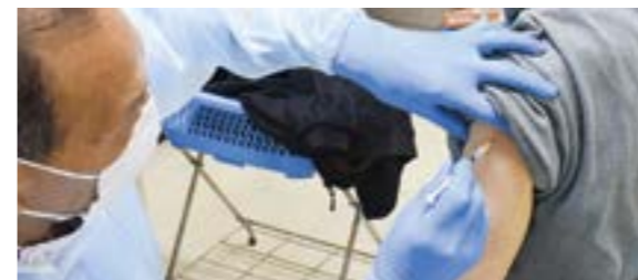
新型コロナウイルスワクチンの接種