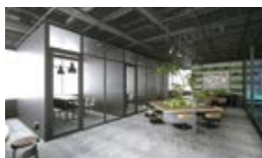
上越妙高駅前のサテライトオフィス

IT企業などのサテライトオフィスを誘致する取り組みを、民間事業者を活用して強化するほか、サテライトオフィスやテレワークなどの拠点となるコワーキング施設の整備を引き続き支援します。