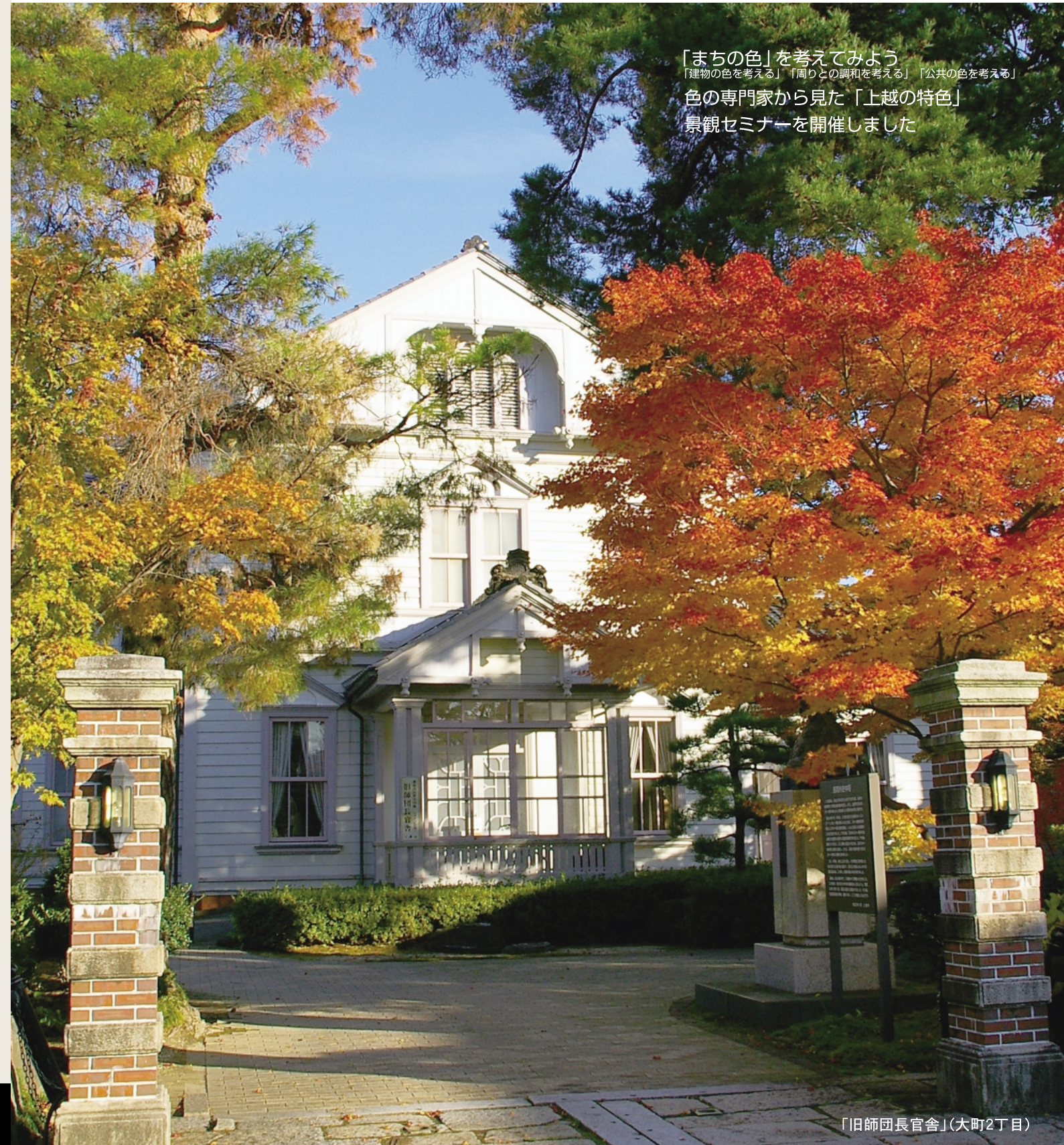
「旧師団長官舎」(大町2丁目)

「まちの色」を考えてみよう 「建物の色を考える」「周りとの調和を考える」「公共の色を考える」 色の専門家から見た「上越の特色」 景観セミナーを開催しました