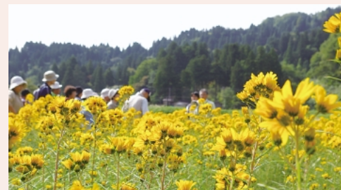
柳葉ひまわり群生地地域取組を学習

参加された皆様からは、「とてもきれいで感動致しました。やはり地区の住民の方々の協力と景観に対する強い思いがあつての成果なんだと思いました。」「広く景観について学習できたので、自分の住む地域でもその意識を持って生活したいと自覚しました。」といった声が聞かれました。