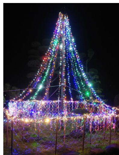
昨年度のイルミネーション点灯の様子