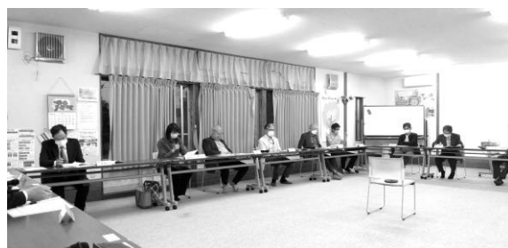
▲5/19の意見交換会の様子