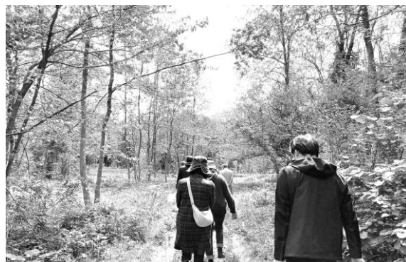
▲雨が降ったあとは靴が水たまりに