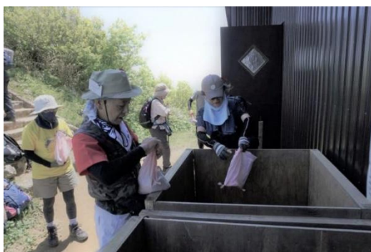
修復のための土あげ運動

上越市と柏崎市とで運営している米山山頂避難小屋連絡協議会が、米山の山頂、薬師堂前の土が流出した箇所の修復のために行っている「米山土あげ運動」も4年目を迎えています。これまで、約11,900人のご協力により9.5トンもの土を上げることができました。下牧登山口と水野林道登山口の2か所に土置き場を設置しています。登山の際には、持てる量の土を袋に詰めて、山頂の土置き場まで運んでください。ご協力をお願いします。