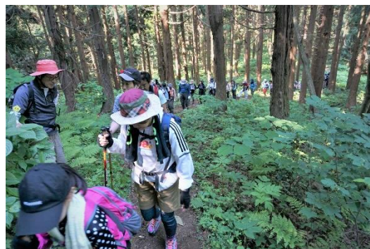
時間をかけてゆっくりと

午前8時に下牧ベース993を出発し、登山を開始。11時からは山頂で全員そろって祈願祭に参加した後、個々で用意した昼食を、山頂の爽やかな風を受けながらおいしく食べ、午後2時ごろには全員が無事下山しました。夏を思わせるような暑さの中でしたが、参加者は米山を存分に満喫した様子でした。