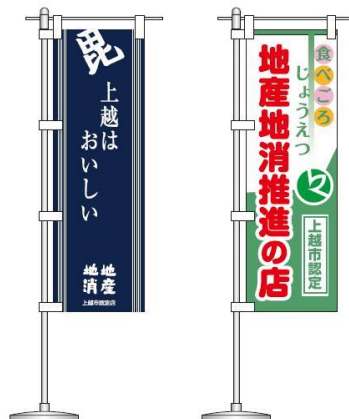
[屋外・卓上のぼり旗デザイン]