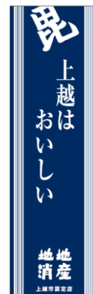
[タペストリー、卓上POPデザイン]