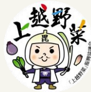
上越野菜認証マーク

※化学合成農薬、化学肥料の使用を控えて作られた地場産農産物や雪室貯蔵された上越産品の入手先などを知りたい場合は、市農政課にお問合せください。