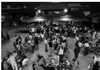
サテライトオフィス