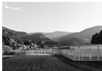
神山高専新校舎パース