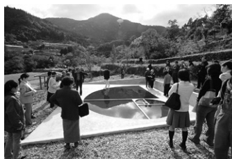
アーティスト・イン・レジデンス