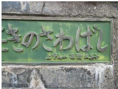
滝ノ沢橋に刻まれた名前

柿崎ダムの隣を走る柿崎小国線に滝ノ沢橋と黒岩橋が、深い緑に吸い込まれるようにかかっています。滝ノ沢橋には四人の名前、黒岩橋には五人の名前が橋の欄干四隅に刻まれています。小学生だった頃、こ