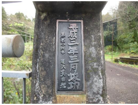
黒岩橋に刻まれた名前

柿崎ダムの隣を走る柿崎小国線に滝ノ沢橋と黒岩橋が、深い緑に吸い込まれるようにかかっています。滝ノ沢橋には四人の名前、黒岩橋には五人の名前が橋の欄干四隅に刻まれています。小学生だった頃、こ