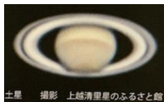
土星 撮影 上越清里星のふるさと館

★木星と土星を中心とした惑星も見頃を迎えています。下旬には、おし座付近の火星も地球との距離が近くなって、急激に明るさを増します。