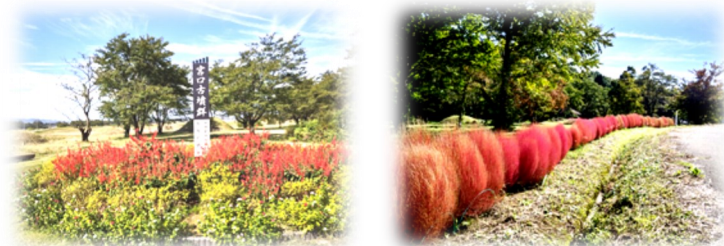
宮口古墳群入口の植栽