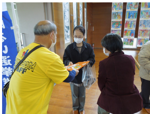
投票を呼びかける協議会委員

＊ ＊ あなたの一票を大切に！ ＊ ＊ 次回の選挙は、令和5年4月執行予定の 「新潟県議会議員一般選挙」です！