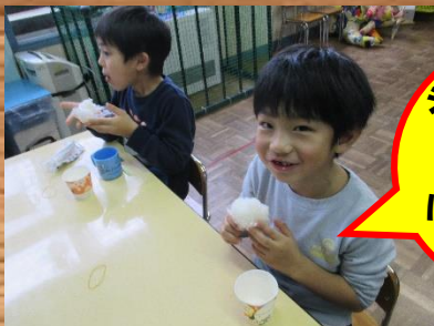
シャカシャカ おにぎり完成！ ほっぺが おちそう。