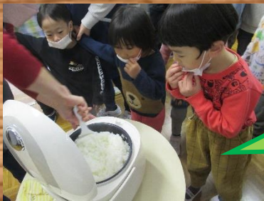
炊き立てのご飯から おいしい匂いがする よー

畑づくりにクッキング、スイカ割りやシャカシャカおにぎりづくり・・・ 食べ物が口へ運ばれるまでの過程を知ったり食べることや命の大切 さを感じたりしながら楽しく食育活動に取り組んできました。いろいろな 経験が心と体の栄養になりました。