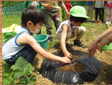
畑に野菜をたくさん植えました！