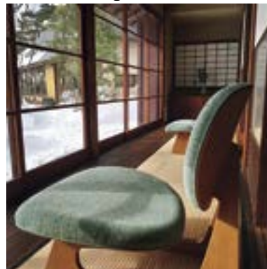
@小林古径記念美術館