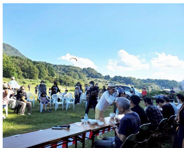
↑尾神岳をバックに熱戦が繰り広げられました

雄大な尾神岳をバックに、スカイスポーツとそばの朝食いで楽しむ人たちで賑わった秋の1日となりました。