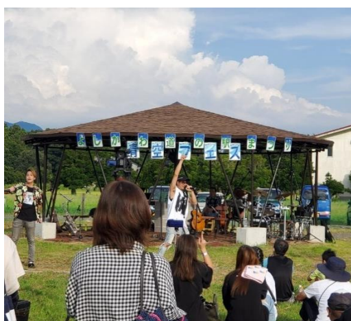
↑ライブパフォーマンスで盛り上がる道の駅広場

吉川観光協会の皆さんは、地域活動支援事業の採択事業である「よしかわ道の駅活性化事業」の一つとして「よしかわ道の駅まつり・青空フェス」を令和4年8月11日に開催しました。