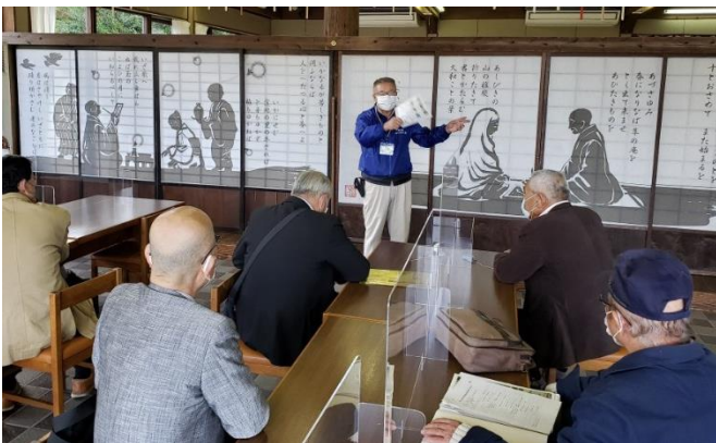
↑ゼネラルマネージャーと意見交換（良寛の里わしま）

今後「道の駅よしかわ杜氏の郷」の活性化を考えて行く上で、参考にしたいと思います。