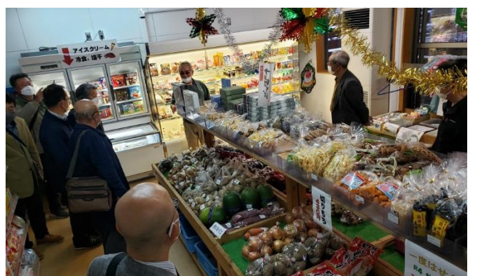
↑地域住民に密着した運営（瀬替えの郷せんだ）