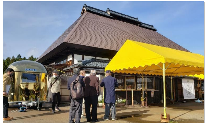
↑古民家を利用した施設（良寛の里わしま）