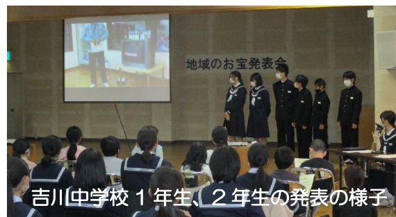
吉川中学校1年生、2年生の発表の様子