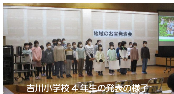
吉川小学校4年生の発表の様子

今回子どもたちがまとめた地域のお宝の数々は「お宝マップ」にまとめられ、今後、区民の皆さんからご覧いただける予定です。