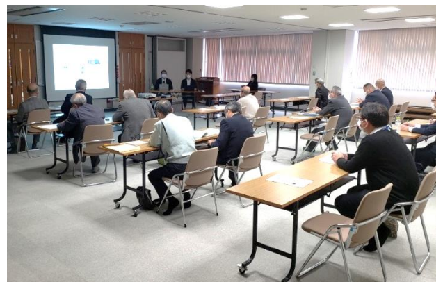
↑道の駅活性化セミナー（令和4年11月17日）

令和4年11月24日には、視察研修を行い、「道の駅 良寛の里わしま」（長岡市）と「道の駅 瀬替えの郷せんだ」（十日町市）を訪問。現地を見学するとともに、関係者と意見交換を行ってきました。