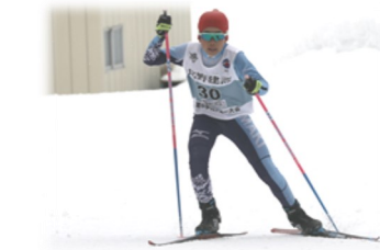
ノルディックコンバインド（距離）