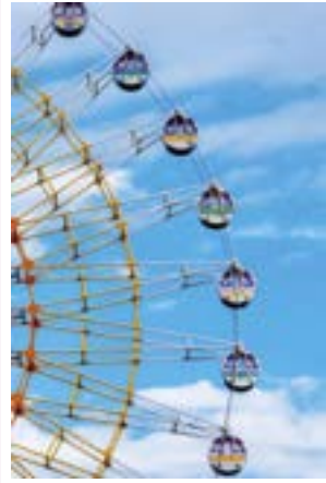
@妙高サンシャインランド