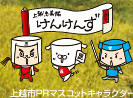
上越市PRマスコットキャラクター

棚田の 農作業 時期 代 か き 4~5月 田 植 え 5月 稲 刈 り 9~10月