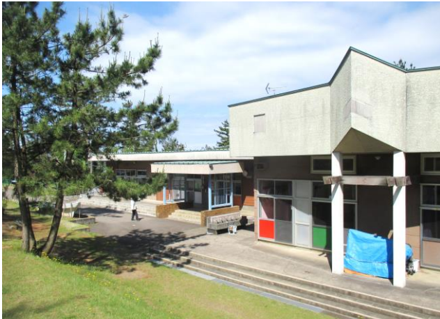
上下浜保育園は昭和 48 年度に新築。築 49 年が経過し、施設の老朽化が進んでいます

施設の老朽化や園児数減少の問題。そして、核家族化や共働きによる家庭環境の変化、勤務体系の複雑化による保育ニーズの多様化。さらに、0 歳児の受け入れができない保育園や開園時間が異なる保育園があり、サービスにも各保育園で差が生じているなど、区内の保育園には多くの課題があります。そこで、私たちは保育施設やサービスのあり方など、子どもたちにとって望ましい保育環境の整備と保育サービスの充実を一番に考え、4 保育園の