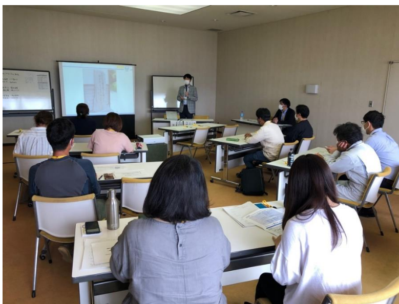
農林水産物等マーケティング活動実践塾の様子

事業継続、販路開拓、新商品または新サービスの開発、DX、IT化等の新たな成長に歩みだす中小企業者等の取組を支援します。