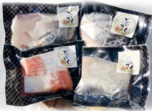
魚のどぶろく漬け

直売所数、直売所の年間販売額はともに増加しています(表7)。また、大型スーパー等のインショップでの直売も19店舗で行われています。