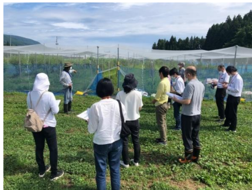
食品関連事業者による農場見学と商談会の様子

※新潟県農山漁村発イノベーションサポートセンターが組織する地域委員会が経営改善戦略の作成及び実行を重点的に支援することについて決定した農林漁業者等