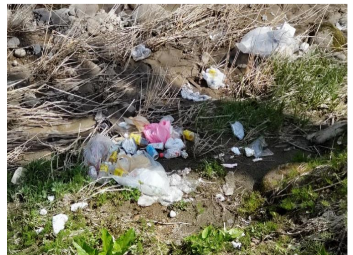
▲大島区内での不法投棄の様子