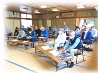
中保倉地区の様子

今回、お聴きした内容については、今後、事業や予算を検討する際の貴重な地域の声として参考にするとともに、回答が必要な案件については、後日、町内会長に報告します。