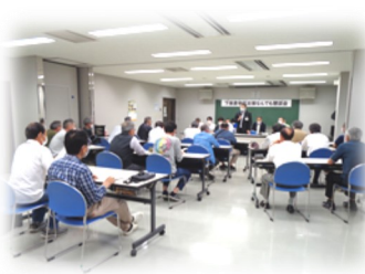
下保倉地区の様子