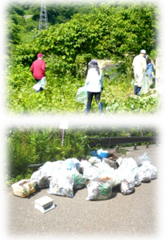
不法投棄防止情報 連絡協議会東部地区 の回収活動の様子

不法投棄は犯罪で、罰則がありますので、不法投棄は絶対にしないでください。もし、不法投棄の現場を目撃した場合は、警察や総合事務所、県の不法投棄ホットラインへ通報してください。