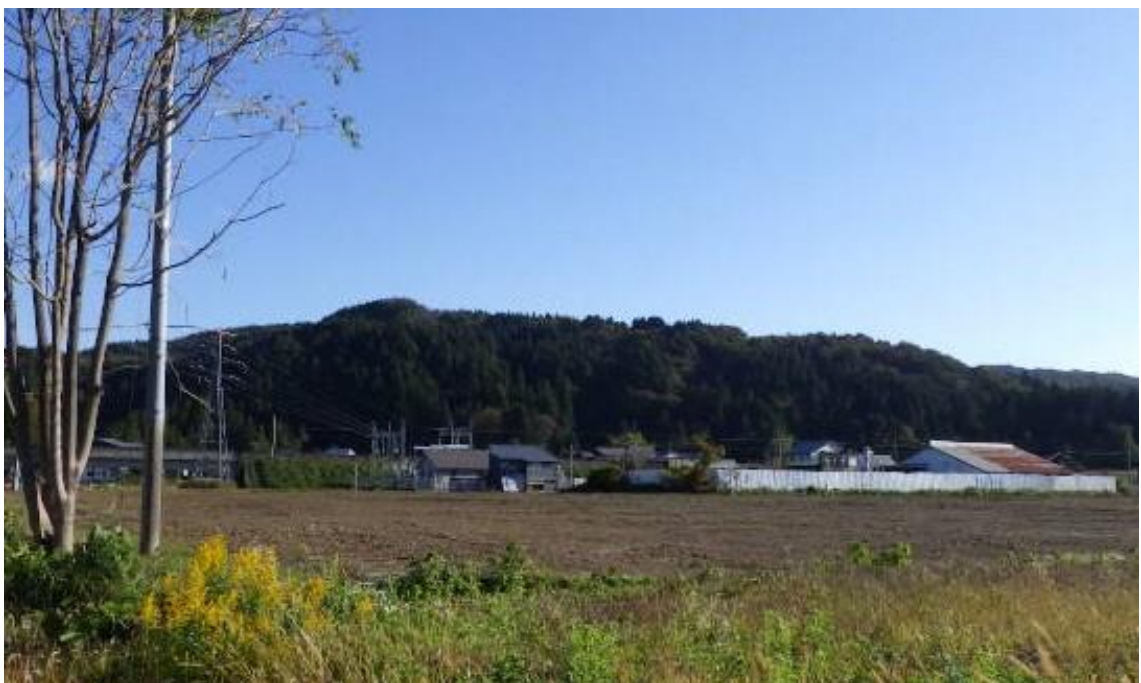
国道253号線から北東方向を撮影