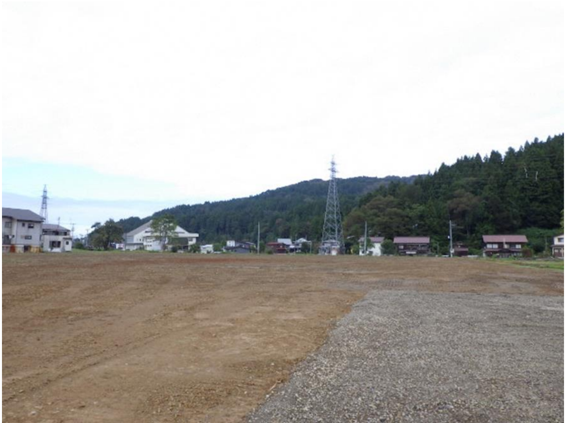
県道61号線柿崎牧線から西方向を撮影