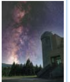
@上越清里星のふるさと館