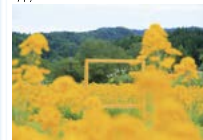
@安塚区のヤナギバヒマワリ