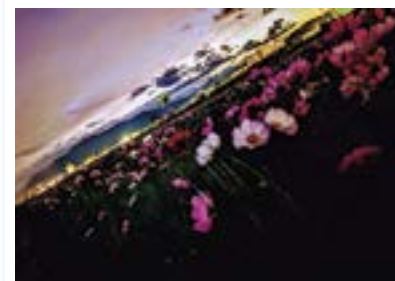
@関川河川敷のコスモス