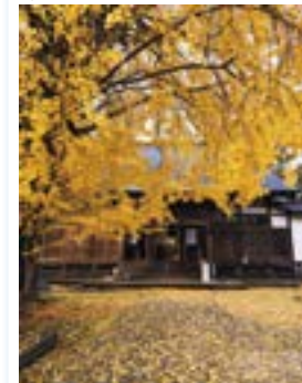
@最賢寺の大イチョウ