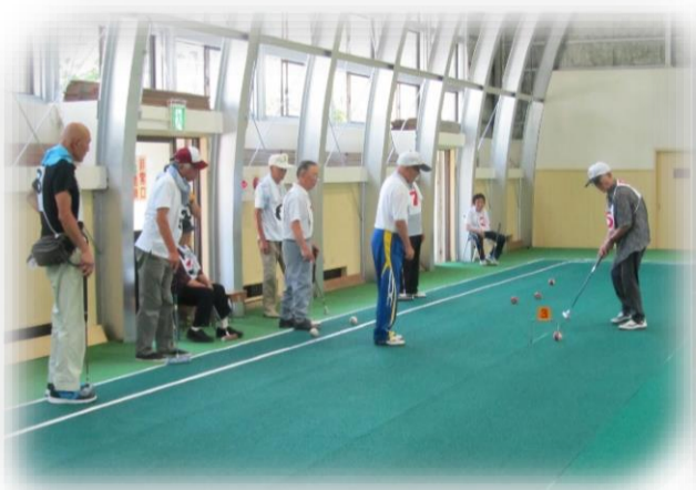
▲大島区シニアゲートボール大会