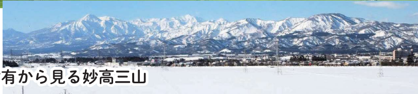
津有から見る妙高三山