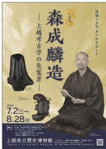
令和 4 年度 企画展「森成麟造」チラシ