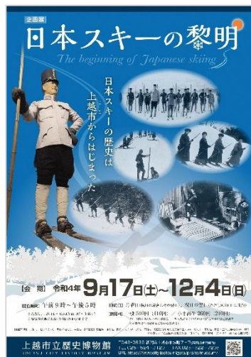
令和 4 年度 企画展「スキーの黎明」チラシ