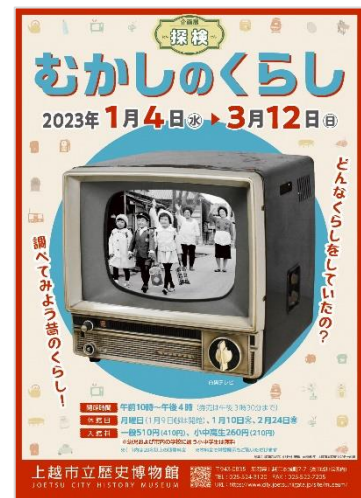
令和 4 年度 企画展「むかしの暮らし」チラシ