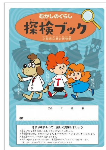
小学生用ワークシート『探検！むかしのくらし』