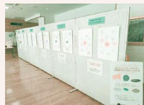
昨年度の展示の様子 (直江津学びの交流館)

男女共同参画サポーター（裏面の上段を参照）の皆さんのご意見を生かした、アンコンシャス・バイアスの例などのパネル展を開催します。会場にあるチェックシートであなたのアンコンシャス・バイアス度を自己診断しませんか？是非お気軽にお越しください。