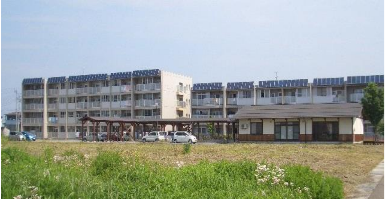
写真：市営子安住宅