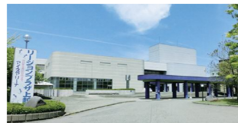
補填対象の指定管理施設は46施設