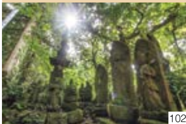
いわやだうくわんおんどう (名立区) 岩屋堂観音堂 岩屋堂町内会