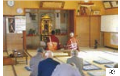
いしざきにじふごにちこう (和田区) 石沢二十五日講 石沢町内会