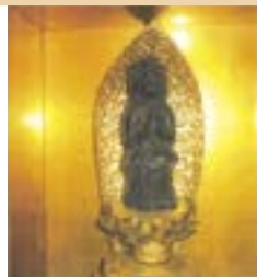
えんらいぼつ かんぜおんぼさつ 円平坊の観世音菩薩 (安塚区) 円平坊町内会