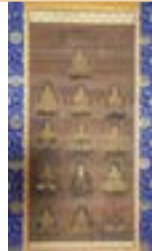
ぶつが 大廣寺の仏画 (板倉区) 宗教法人 大廣寺