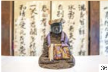
だいこうじ ひぶつ 大廣寺の秘仏 (板倉区) 宗教法人 大廣寺