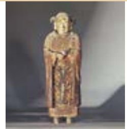
せいとくすいぞう (浦川原区) 聖徳太子像 菱田町内会