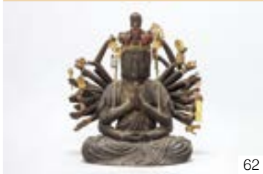
もくぞうしゅういちめんせんじよかんのおんざう 木造十一面千手観音坐像 (金谷区) 飯地区町づくり協議会