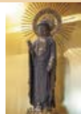
もくぞうあみだにょらいりゅうぞう 木造阿弥陀如来立像 (板倉区旧西源寺本尊) (清里区・板倉区) 宗教法人福浄寺