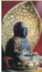
しほつ 賞泉寺寺宝 (安塚区) 宗教法人 賞泉寺