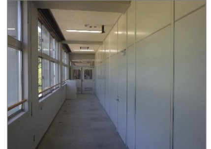
【少人数指導のための教室間仕切りを設置】