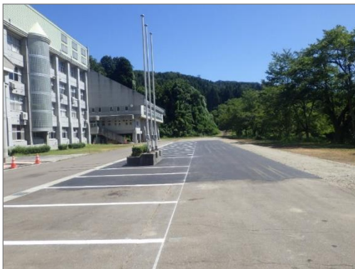
【駐車場未舗装部分の舗装整備】