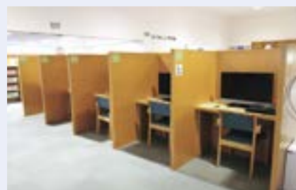
直江津図書館CD・DVD視聴席