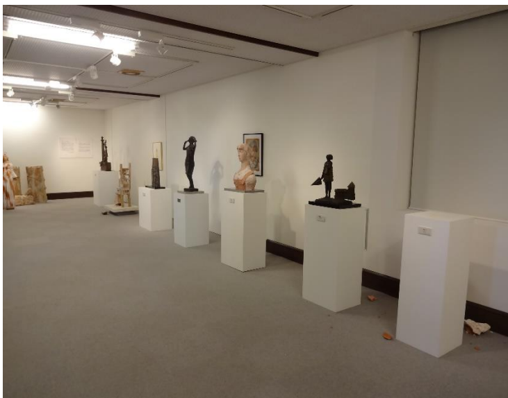
高田まちかど交流館 (2階)