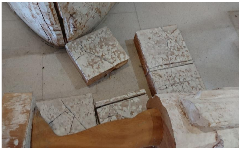
作品破損状況 (峯田彫刻作品)