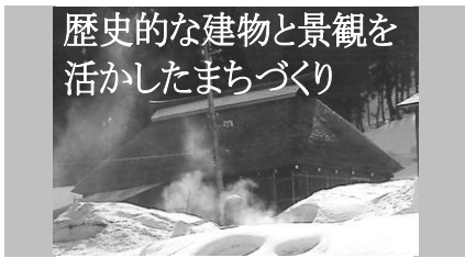
歴史的な建物と景観を 活かしたまちづくり

市民の皆さんの多様な発想や意見をまちづくりに活かすため、昨年7月からスタートした市民研究員制度。座長をお願いしたお二人から、これまでの活動を振り返るとともに、これからのまちづくりへの思いを語っていただきました。