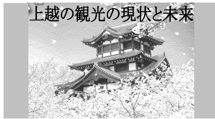
上越の観光の現状と未来

懐かしい町並み、懐かしい家屋を、今を生きる我々の生活のために活かして使用することのできる方法を考えていきたいと思っております。